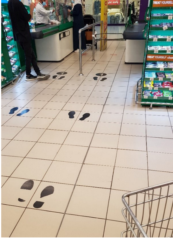
الشكل رقم (٨). التباعد عند صناديق المحاسبة في الأسواق المركزية ومحلات التموينات الغذائية

وبناء على ما سبق، فهذه توصيات مستقبلية تحقق استجابة أكبر لمتطلبات الفراغ الشخصي، بما يحقق المتطلبات الوظيفية مع مراعاة تهيئة الفراغ ليكون ملائماً بدرجة أعلى للمتطلبات الصحية: