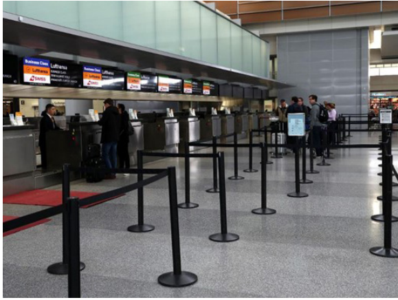
الشكل رقم (١٨). حواجز لتنظيم الطوابير ومنع التجاوز (٣٠)

تظهر الأبعاد السلوكية الاجتماعية للفراغ الشخصي بوضوح في الطوابير بسبب طبيعة التفاعل البشري فيها من جانب، وتنوع آليات التعامل معه وارتباطاتها الإنسانية والثقافية. ومن ذلك تقليل الحاجة إلى وقوف الأشخاص في طوابير، بتقديم الخدمة عن بعد مثلا، وضع حواجز تحدد المسارات بما يمنع تجاوز الأشخاص الواقفين (الشكل ١٨)، استخدام علامات أرضية تحدد أماكن الوقوف بما يحقق التباعد الشخصي (الشكل ١٩)، تقليل عدد مراجعي الجهات الحكومية بحجز موعد مسبق قبل الحضور.