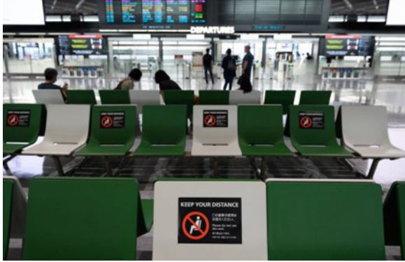
الشكل رقم (١٥). وضع علامات تمنع الجلوس في المقعد الأوسط في الجلسات الطولية (٢٩)

الناس أثناء جلوسهم، ومن ذلك ترك مقعد فارغ بين كل مقعدين في الجلسات الطولية (الشكل ١٥) أو التي تحتوي ثلاثة كراسي (الشكل ١٦)، أو ترك مقعد شاغر في الجلسات التي يوجد فيها كرسيان متقاربان فقط. إضافة إلى ذلك، فقد تم تقليل عدد الكراسي والطاولات في الأماكن المزدحمة، والاكتفاء بالعدد الذي يحقق متطلبات التباعد الشخصي بين الزبائن.