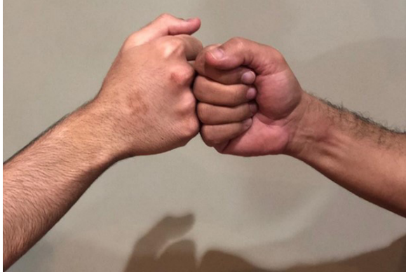
الشكل رقم (١). صار التلامس بقبضة اليد وسيلة بديلة للمصافحة بين الأشخاص وقت كوفيد-١٩

فإنه يعبر بدرجة أقل وضوحاً عن رغبته في تحقيق مستوى صارم من التباعد الشخصي مع الآخرين، إذ تبقى فرصة المصافحة متاحة لو رغب فيها الطرفان، أو باستخدام بدائل المصافحة التي شاعت إبان انتشار الجائحة (الشكل ١).