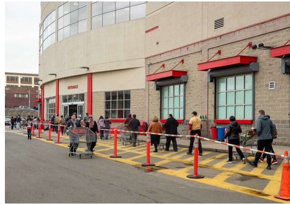
الشكل رقم (٧). طوابير المتسوقين خارج مركز للتموينات الغذائية، يظهر فيها التباعد الشخصي بوضوح (٢٤)

كانت هناك بالطبع اشتراطات صارمة، ولاسيما في وقت اشتداد الجائحة، مع حرص شديد من الجهات الصحية، مدعومة بالأجهزة الأمنية، على تقليل الاحتكاك بين الأشخاص إلى أقل قدر ممكن. وبالتالي فقد مُنِع الخروج من المنازل إلا في ساعات محددة من النهار لقضاء المستلزمات الضرورية من محلات بيع المواد التموينية ومحطات بيع الوقود والصيدليات، وفي نطاق الحي الذي يسكن فيه الشخص، مع مراعاة عدم تجاوز عدد المتسوقين العدد الأقصى الذي يحقق التسوق الآمن بمراعاة التباعد الشخصي في تلك الأسواق. ويمكن لمن يرغب، في حال الوصول إلى السعة الاستيعابية القصوى، الانتظار خارج المحل حتى يخرج بعض الزبائن ليتيحوا الفرصة لدخول متسوقين آخرين (الشكل (٧)). كما أُلزمت المحلات بتوفير علامات أرضية توضح الأماكن التي يسمح فيها بالوقوف عند صناديق المحاسبة (الشكل (٨)).