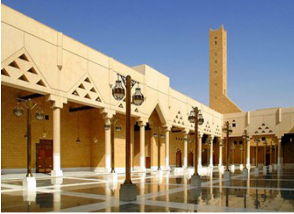
الشكل رقم (٦). الفناء المفتوح لجامع الإمام فيصل بن تركي، بعد إعادة بنائه على الطراز التقليدي بأسلوب معاصر (٢٣)