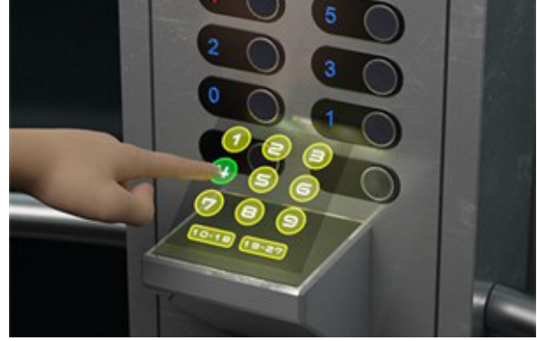
الشكل رقم (١٣). مصعد يمكن التحكم فيه بشاشة ضوئية لا تحتاج اللمس (٢٧)