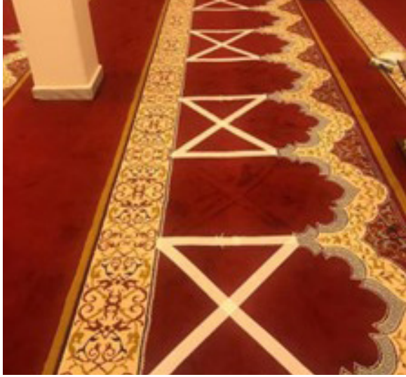
الشكل رقم (٣). نموذج لعلامات أرضية لتوضيح المواضع المناسبة لوقوف المصلين في المساجد (18)

وقد كانت المساجد بشكل خاص ميدانا لاجتهادات متنوعة قام بها أئمة المساجد لتحقيق التباعد الشخصي بين المصلين. وتنوعت بالتالي الوسائل التي استخدمت فيها خاصية البحث عن الملامح (cue searching) لتوضيح أماكن وقوف المصلين (الشكل ٣).