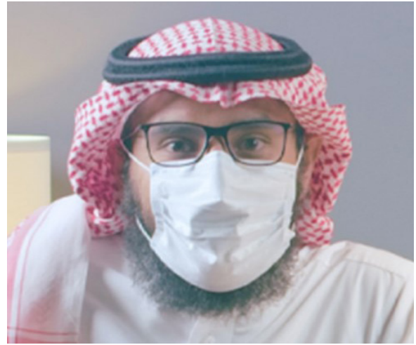
الشكل رقم (٢). ارتداء الكمامة بشكل يغطي معظم ملامح الوجه يجعل الشخص غالبًا مجهول الهوية (13)

(الشكل ٢) وسيلة تخفي هوية الشخص وتبقيه في دائرة المجهولية (anonymity)، التي تعد أحد أنواع الخصوصية وفقًا لتصنيف (Westin, 1970). وهذا بدوره يقلل قدرة الآخرين على التعرف على هوية الشخص. وأحيانًا يترددون في الاقتراب منه، حتى ولو كانوا يعرفونه بشكل شخصي؛ مما يتيح له فرصة تجنب المواقف التي يضطر فيها إلى التفاعل الاجتماعي والتقارب الشخصي، مقارنة بما لو كانت هويته واضحة. وبالتالي تعطي الفرد فرصة أكبر في المحافظة على فراغه الشخصي.