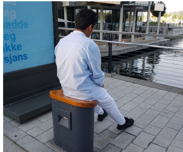
الشكل رقم (١٧). مقعد مخصص لشخص واحد في مكان عام