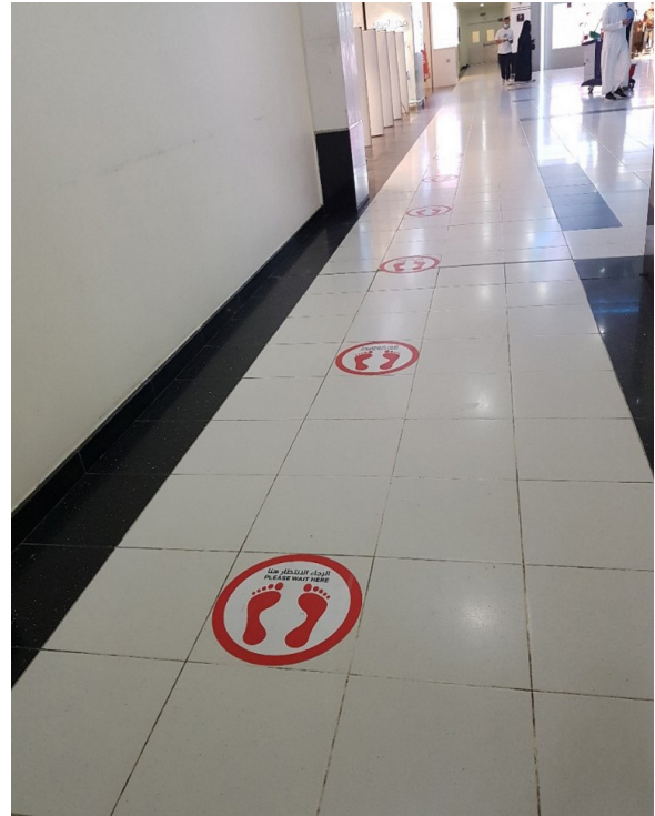
الشكل رقم (١٩). الطوابير وفقاً للعلامات الأرضية التي تحقق تباعداً شخصياً بين الأشخاص