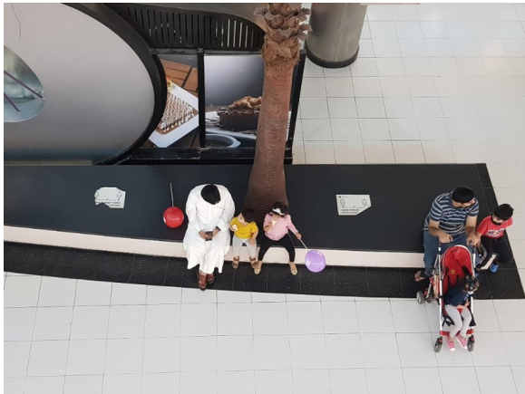
الشكل رقم (١٦). الجلسات الطولية في الأسواق أو الأماكن العامة تترك فراغا بين كل شخص وآخر، أو عائلة وأخرى