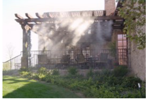
الشكل رقم (٩). جلسات خارجية في الهواء الطلق، يستخدم فيها التشجير وبخاخات الرذاذ المائي لتخفيف درجة الحرارة (٢٥)