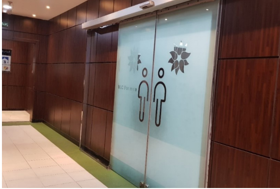
الشكل رقم (١٠). باب كهربائي منزلق يفتح بواسطة حساس الحركة